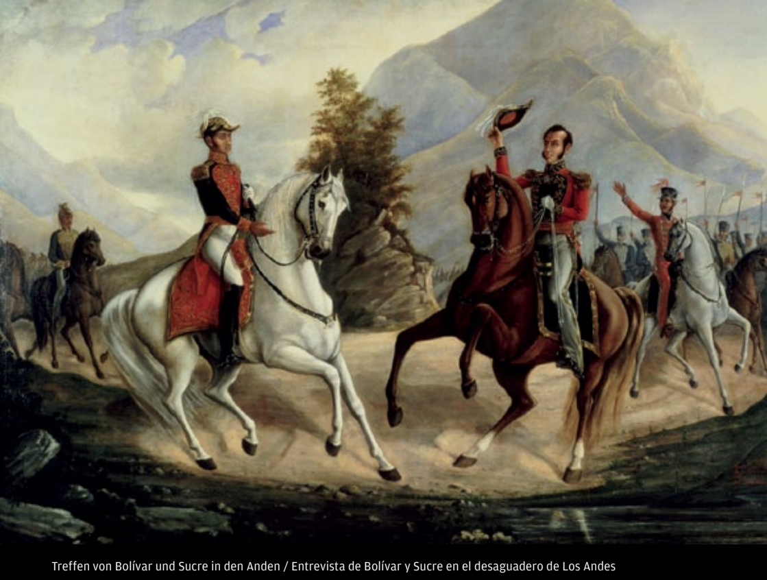
Treffen von Bolívar und Sucre in den Anden / Entrevista de Bolívar y Sucre en el desaguadero de Los Andes