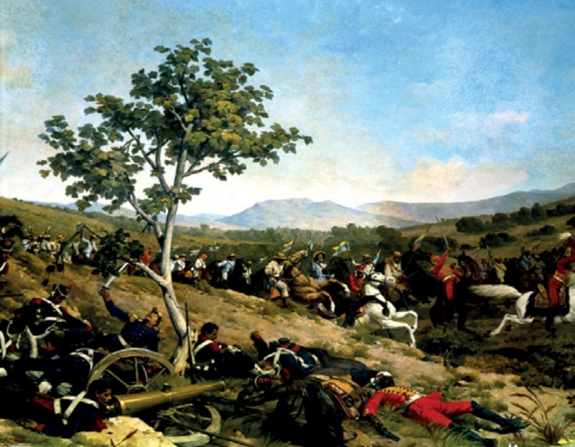
Schlacht von Carabobo: 24. Juni 1821 / Batalla de Carabobo: 24 de junio de 1821

Die Kritik am Kolonialregime, die Verbreitung der separatistischen Ideen und der Druck auf den Kongress, die Unabhängigkeit zu erklären, waren die wichtigsten Aktionen der Patriotischen Gesellschaft.