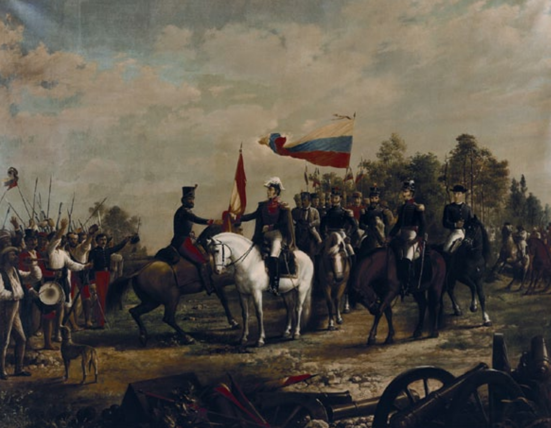
Übergabe der siegenden Flagge von Numancia / Entrega de la Bandera Victoriosa de Numancia

über Wirtschaft, Politik sowie zivile religiöse und militärische Angelegenheiten diskutiert. Sie erreichte eine Mitgliederzahl von über 600 Mitgliedern allein in Caracas, mit Filialen in Barcelona, Barinas, Valencia und Puerto Cabello. Ab Juni 1811 war die Zeitschrift „El Patriota Revolucionario“ ihr Verbreitungsorgan.