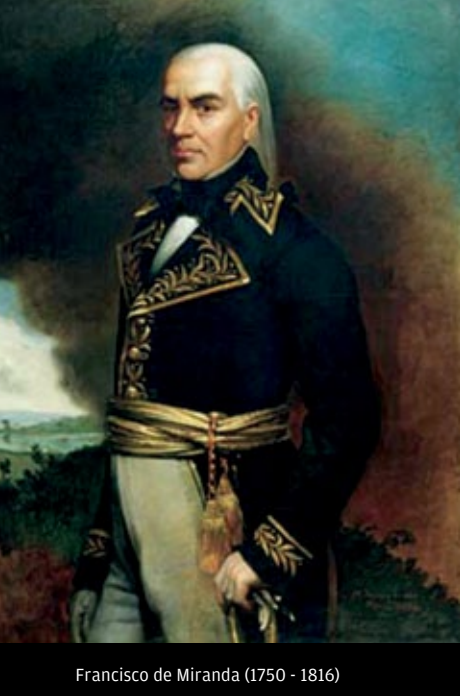
Francisco de Miranda (1750 - 1816)