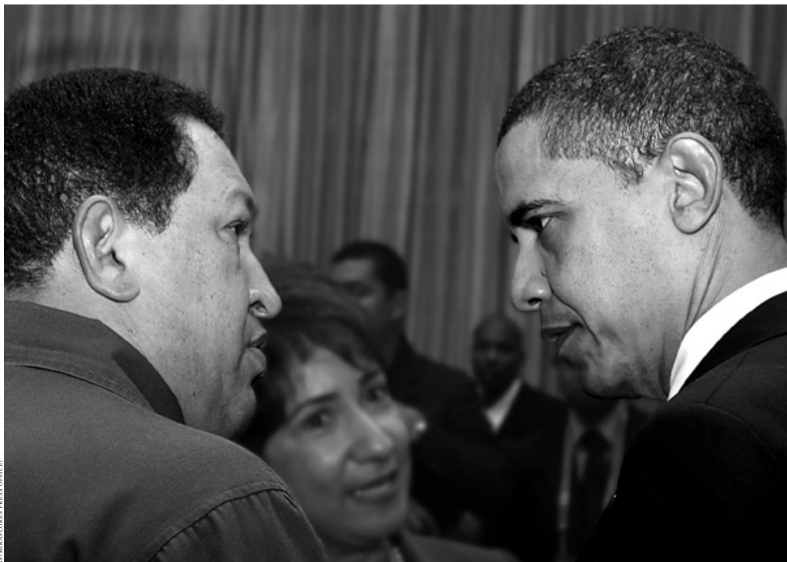
»Obama! Bist du das, oder ist das ein anderer Obama? Obama One or Obama two?« Hugo Chávez in seiner UN-Rede zu den Abrüstungsvorschlägen des US-Präsidenten bei gleichzeitiger Unterstützung der Militärs in Honduras (5. Gipfeltreffen der OAS-Staaten, 19.4.2009)

(...) Wir sind Millionen, und nichts und niemand kann diese große südamerikanische, lateinamerikanische und karibische Revolution aufhalten. Ich denke, die Welt sollte sie unterstützen. Die USA sollten diese Revolution unterstützen, Europa sollte diese Revolution unterstützen, denn diese Revolution ist, und das haben einige Brüder und Schwestern noch nicht gemerkt, der Beginn des Weges zur Rettung dieses Planeten, zur Rettung der vom Kapitalismus, vom Imperialismus, von Krieg und Hunger bedrohten menschlichen