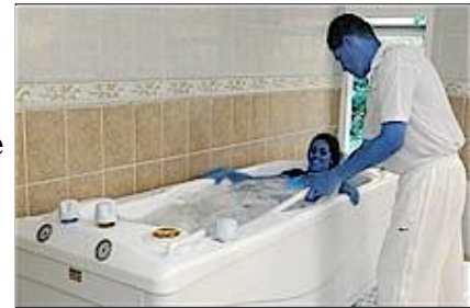
Das Zentrum SPA Talaso in Cayo Coco.