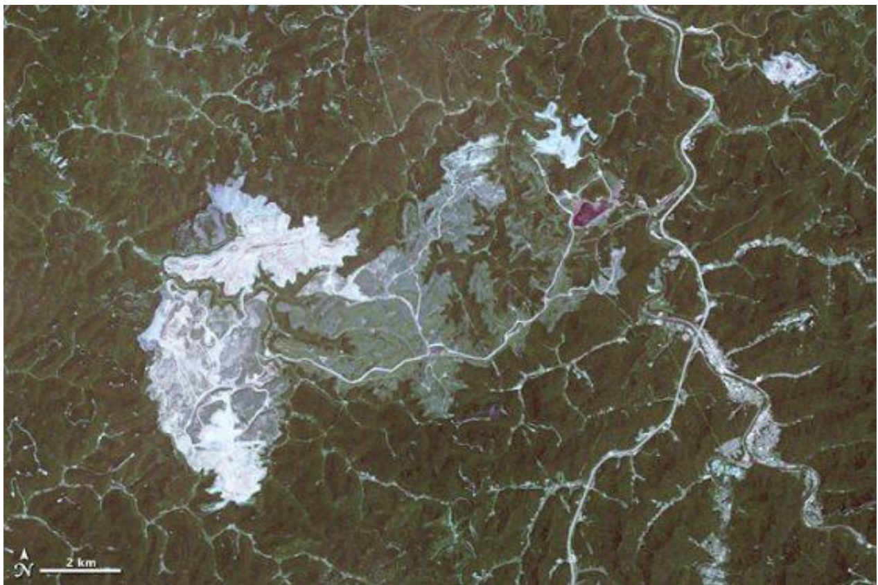
Hobet Mine in West-Virginia, im Juni 2009.

Auch von Staats wegen geraten Kohlekraftwerke und Kohlebergbau unter Druck, seit die