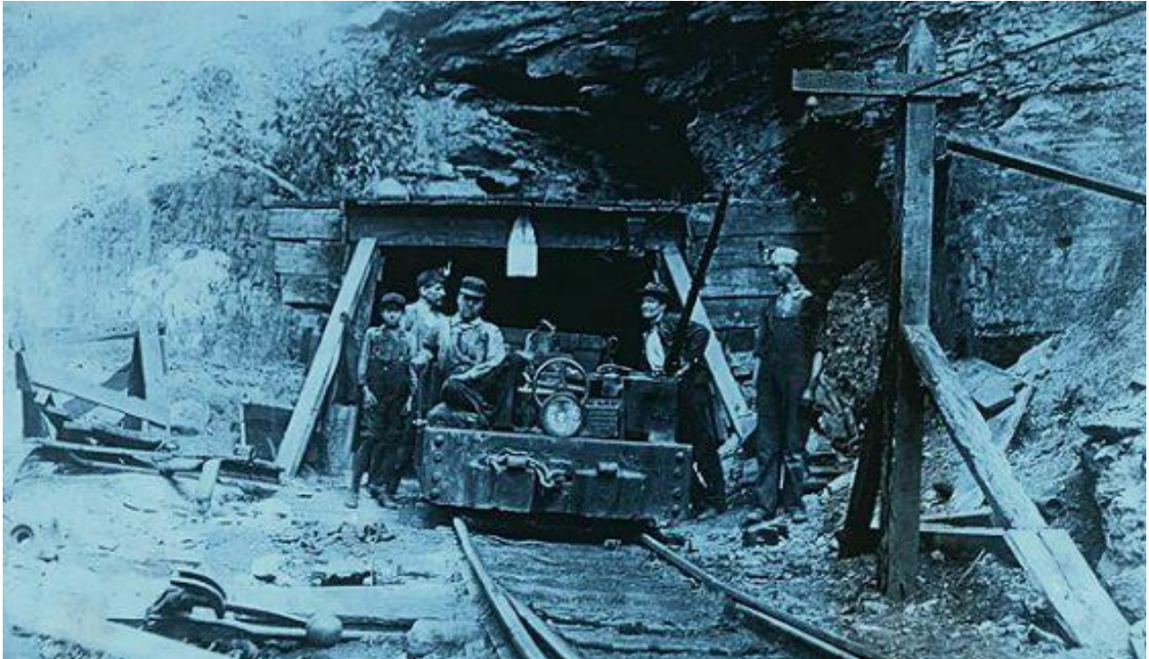
Eingang zu einem Kohlenbergwerk in West-Virginia, September 1908.

den Vorwurf der grossflächigen Landschaftszerstörung wandten die Energiefirmen zunächst ein, das flachgemachte Land könne landwirtschaftlich genutzt werden; sie setzten sich damit dem Vorwurf des Zynismus aus. Zu Vorhaltungen wegen der Umleitung von Wasserläufen und Wasserverschmutzung – unter anderem wurden Arsenfrachten nachgewiesen – konnten sie nicht viel Entlastendes vorbringen. Und der Klimawandel wird heute als Tatsache anerkannt; auch die Lobbyarbeit der sogenannten Klimaskeptiker kann die Betreiber von Kohlekraftwerken in diesem Punkt nicht mehr wirklich entlasten.