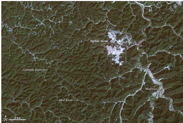
Hobet Mine in West-Virginia, im September 1984.

Removal betreiben – also den Kredithahn zuzudrehen.