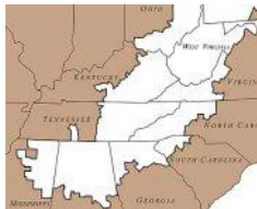
Region Appalachen, südlicher Teil.

Kohleförderung in den Appalachen betreibt namentlich der US-Energiekonzern Massey , und dieser gehört zu den industriellen Kunden der UBS. Wegen dieser Geschäftsbeziehung ist die Schweizer Bank in den USA in letzter Zeit unter Druck geraten, denn amerikanische Umweltschützer und Bankenkritiker machen seit Jahren gegen die Kohleförderung in den Appalachen mobil.