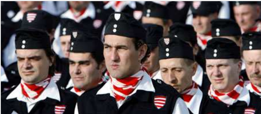
Die Mitglieder der Miliz der "Ungarischen Garde" marschieren in schwarzen Uniformen - gerne auch in Stadtvierteln, die von Roma bewohnt werden.

Jobbik ist mit dem lauten Auftreten nicht allein: Sekundiert werden die Populisten von der Ungarischen Garde, einer in schwarzen Uniformen paradiierenden Miliz, deren Ausstattung stark an die faschistischen Pfeilkreuzler erinnert. Diese hatten den Nazis bei der Judenvertreibung und -vernichtung in Ungarn eifrig Hilfe geleistet.