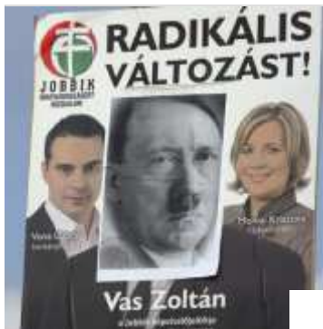
Keine Partei polarisiert in Ungarn stärker als die Jobbik: Ein Wahlplakat mit Gábor Vona und Krisztina Morvai wurde in Budapest mit einem Hitlerbild "verziert".

Bei den Wahlen zum Europaparlament im vergangenen Jahr konnte die extrem europakritische Gruppierung immerhin auch schon 15 Prozent erobern und drei Abgeordnete nach Brüssel schicken - darunter die meist mit viel teurem Goldschmuck behängte Krisztina Morvai. Die attraktive Blondine möchte sich gern im Sommer vom neu zu wählenden ungarischen Parlament zur Präsidentin des Landes wählen lassen.