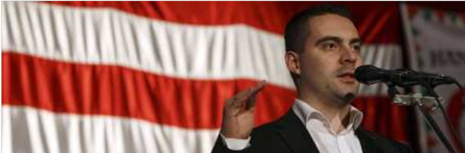
Der 31 Jahre alte Gábor Vona steht an der Spitze der rechtsradikalen Partei Jobbik.

Es sind Sätze wie aus einer anderen Zeit: "Wir werden aufräumen und Ordnung schaffen. Die einen werden Arbeit und Chancen erhalten, und anderen einen Platz im Gefängnis." Gábor Vona hielt seine Grusel-Rede vor Tausenden jubelnden Anhängern am 15. März in Budapest, am Jahrestag der Revolution von 1848 - einem Feiertag in Ungarn, an dem des Aufstandes gegen die Habsburger gedacht wird.