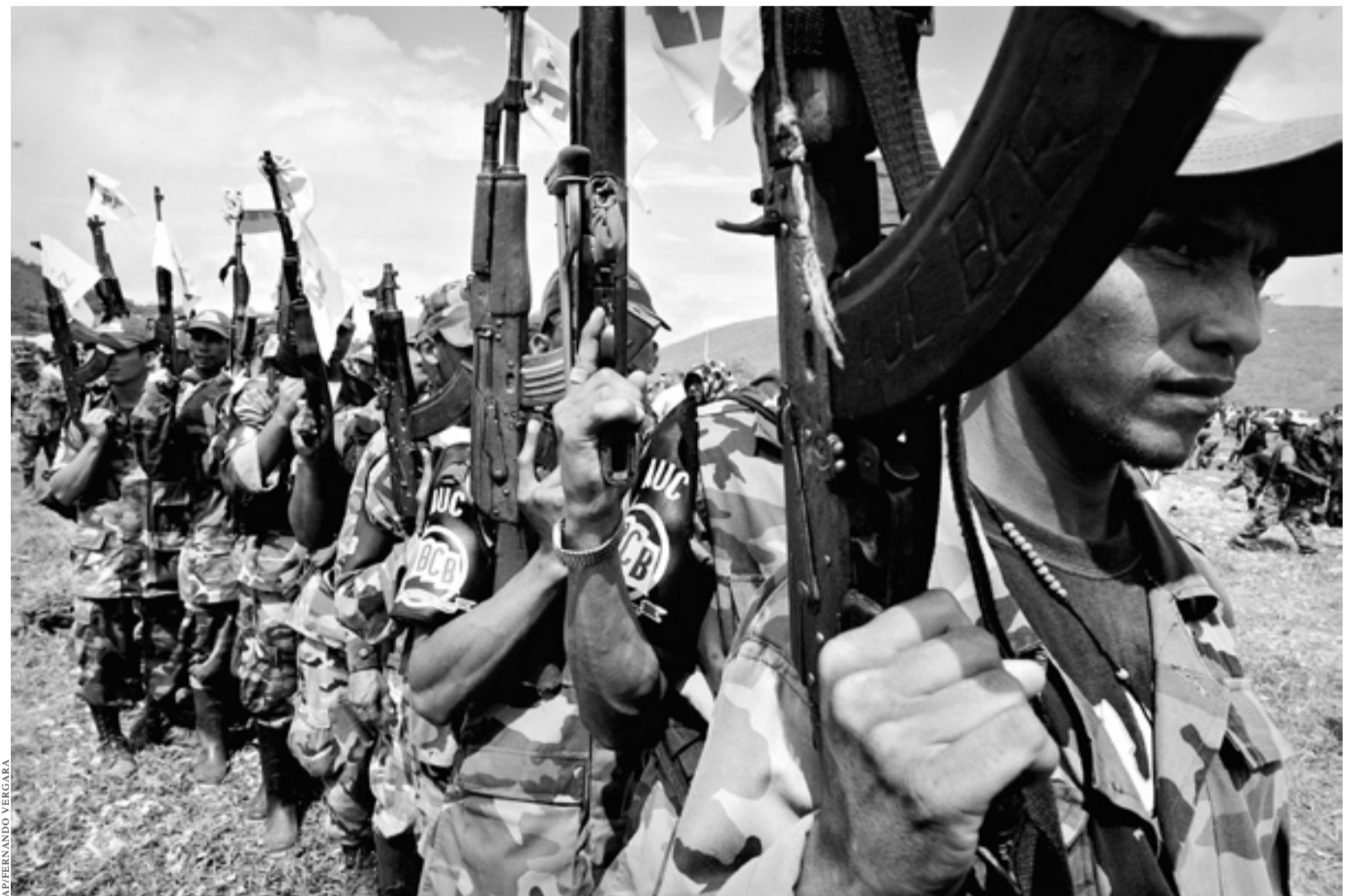
Kolumbiens Senator Gustavo Petro über Venezuela: »Männer zu konzentrieren, um einen Terrorkrieg zu führen, wenn eine extrem mächtige Opposition es anweist« (Paramilitärische Einheiten der Autodefensas Unidas de Colombia in Otu/Kolumbien, 12.12.2005)

Kolumbianische Paramilitärs sind in Venezuela sehr präsent, besonders im Grenzgebiet. In den Bundesstaaten Táchira, Apure, Barinas und Zulia haben der kolumbianische Paramilitarismus und der Drogenhandel, die oftmals identisch sind, große wirtschaftliche Interessen und können auf die Zusammenarbeit sowohl oppositioneller als auch »bolivarischer« Bürgermeister zählen. Paramilitärs beherrschen den Drogenhandel, kassieren Schutzgelder von Geschäftsleuten, kontrollieren den Schmuggel von Benzin und Nahrungsmitteln nach Kolumbien und kollaborieren in einigen Fällen mit Soldaten der Streitkräfte der venezolanischen