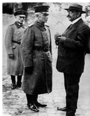
Galerie einer Reichsregierung für drei Tage: Wolfgang Kapp, Erich Ludendorff, Walther Freiherr von Lüttwitz und der abgesetzten legale Reichswehrminister Gustav Noske

Die Reichswehr unter Generaloberst von Seeckt schützte während dieser Putschtage die legale Regierung nicht. Unter seinem berühmten Motto - „Reichswehr schießt nicht auf Reichswehr!“ verhielten sich die Heereskräfte abwartend.-Deshalb konnte dieser „Kapp-Putsch“ nur durch einen Generalstreik in Deutschland bezwungen werden, ausgerufen durch den Allgemeinen Deutschen Gewerkschaftsbund. Dieser einzigartige politische Generalstreik, der die gesamte Wirtschaft und das öffentliche Leben lahm legte, zwang die Putschisten nach 3 Tagen zur Aufgabe und Flucht nach Schweden.