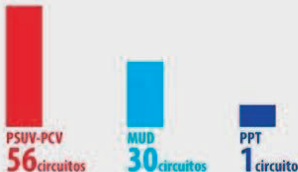
Verteilung der politischen Kräfte pro Wahlkreis (Circuitos)

„Sie sagen, dass sie die Mehrheit sind, dass sie mehr Stimmen haben bekommen haben aber das ist eine Lüge. Wie immer manipulieren Sie. (...) Wir haben bei den Stimmen gewonnen und bei der Anzahl der Abgeordneten...“